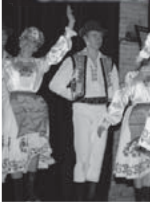
(Окончание. Начало на 1-й с.)

Открывая концерт, министр культуры Руслан Фиров вспомнил молодость: «Все, что близок возрастом к моему, помнит, что еще во времена Советского Союза этот ансамбль своим талантом и темпераментом завоевывал сердца зрителей всего мира...»