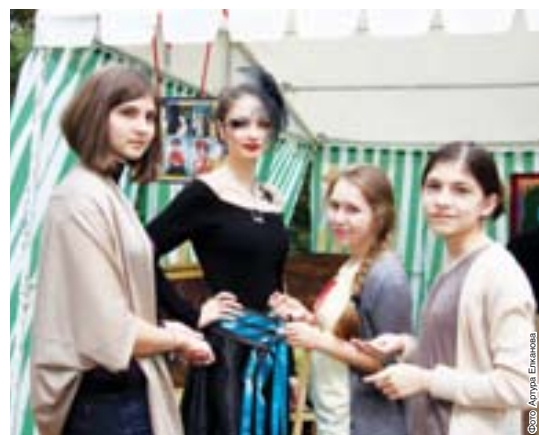
Ото Камалял Тору Урава

Дочка меня завела в симпатичный вышитый платок, где юные визажисты надели на мое лицо «бевею раскраску». При других обстоятельствах никогда бы на такое не решился, а тут все получилось весело. – смеется дама солидного вида. – Лет двадцать не танцевал, но неожиданно для себя пошел в кружок танцев. Танцевать, когда ей так весело. А внуку чуть в шахматы не проиграл – скоро пере-