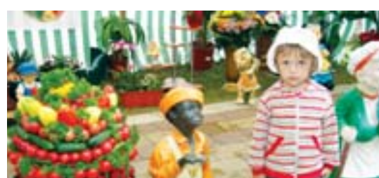
Ото Камалял Тору Урава

растет репа, – удалялся по аллее, бросил через плечо седовласый господин. – Я сначала испугалась, а потом дядя клоун оказался добрым, мы с ним мыльные пузыри пускали! – продолжила во время разговора скакать на одной ножке, взахлеб пропела малышка. Ее мама, залобовавшаяся чудом-композицией из овощей и фруктов, решила, что на дочку пятилетие попробует сделать нечто подобное – на вид не сложно, можно поэкспериментировать.