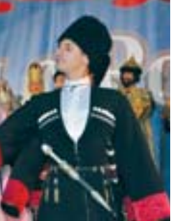
Ото Камалял Тору Урава