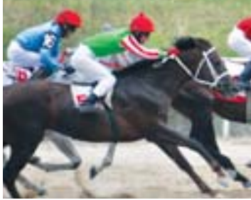
Ото Камалял Тору Урава