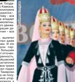
Ото Камалял Тору Урава

матрешечки в оранжевых сарафанчиках. А под юнчи на эту веселую толпу пролился целый дождь из серпантинки. Молодые, но по-взрослому эlegantные танцоры ансамбля «Каллисто» поразили не только мастерством, но и красотой костюмов. Юнчи в черных фраках, девушки в пурпурных бальных платьях вызвали у меня легкую зависть – ну почему я не умею танцевать бальные танцы!