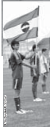
Окончание. Начало на 1-й с.

Следующие два объекта, которые посетил Арсен Канокоев – новый многоквартирный дом на улице Московской и новый корпус начальной школы «Устех». Новая семикласска построена по программе ипотечного кредитования. Застройщик – ОАО «Кабардино-Балкарская республиканская ипотечная корпорация», 100 процентов акций которой принадлежит КБР, что позволило обеспечить доступность жилья. На разных этапах строительства стоимость одного квадратного метра обошлась владельцам квартир от 26 до 30 тысяч рублей, что значительно ниже рыночной. Арсен