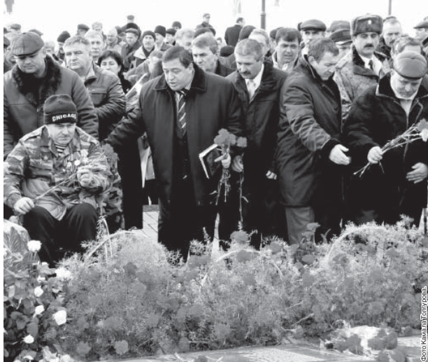
Окончание. Начало на 1-й с.

Мы должны быть благодарны тем, чьи имена выгравированы на этом монументе... «Кабардино-Балкария».