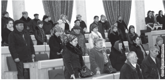
Окончание. Начало на 1-й с.

Кода наивка я така и так... Кабинетов террористов и радикальных исламистов. По словам главы республики, финансовые средства из этого фонда будут направлены на учебные стипендии в общеобразовательных школах и высших учебных заведениях, обучающихся ипотечных и иных целевых кредитов в банковских учреждениях, обеспечение достойной старости родинкам Героев Отечества.