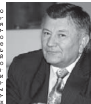
Окончание. Начало на 1-й с.

Местное самоуправление, по мнению Путина, должно оставаться в «шаговой доступности» для простых граждан, то есть муниципалитеты не должны бездумно укрупняться. При этом, как мне представляется, они должны стать проводниками государственной политики на местах, финансово состоятельными и автономными, в полной мере способными решать организационные, экономические, социальные вопросы через прямую повышение благосостояния граждан, проживающих на соответствующих территориях.