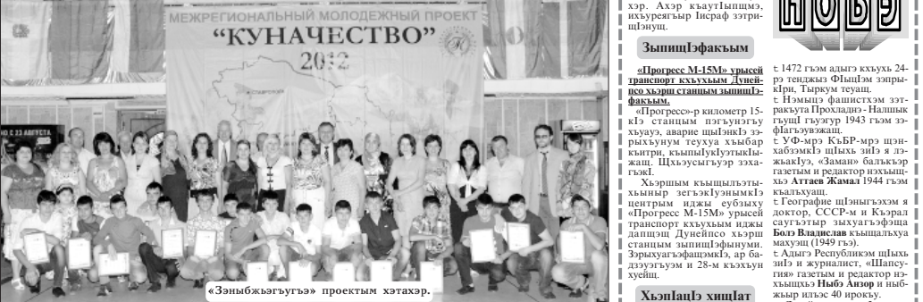
«Зэныбжьэгугьтэ» проектм хэтар, АЛУКУЭ Арино