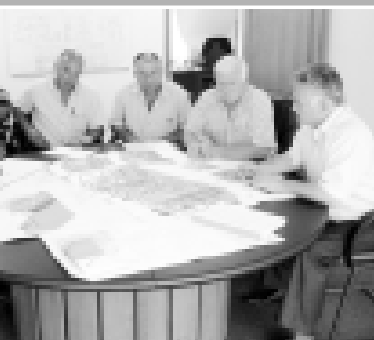
Участкалы таматарлары кенгеси.

лага бизнес-планы хазырлау эм кредит сред-ства излуу бла кюрюшип башлагъан эдиле. 2002 жылда ол муратларына жетедиле эм ишле башландыла. «Элбрустром» генераль-ный поддрячик болды эм Хасмыны башчы-лыгында толу болганды эки жылды ичинде заводну сутахга 120 тонна продукция чыгар-ган биринчи кезиуу ишенип, хайырланьаргъа берилди.