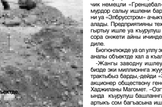
Къурулуш барганды объектде.

Озгъан ёмкюро тохтаганыны жарлырны ор-тасында окуна Гызыланы Хасмыны башчы-лыгында специалистлени къаууму ол мурат-къурулуш барганды.