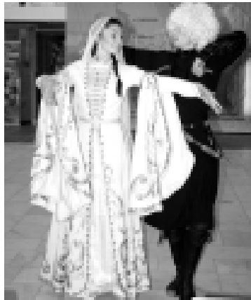
«Басият» ансамблин солистрери теспейдиле.