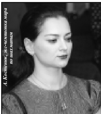
А. Костиков, экс-чемпионка мира по шахматам

8 октября в штур-отеле «Синдика» в Нальчике прошла торжественная церемония открытия третьего этапа Гран-при ФИДЕ по шахматам среди женщин.