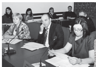
Сотрудники администрации Кабардино-Балкарской Республики в ходе встречи с президентом республики.

Участие в таких мероприятиях приносит положительные плоды. Так, подписание соглашения о сотрудничестве между Республикой Азербайджан и Кабардино-Балкарской Республикой, между администрациями города Каспи (Турецкая Республика) и городского округа Нальчик.