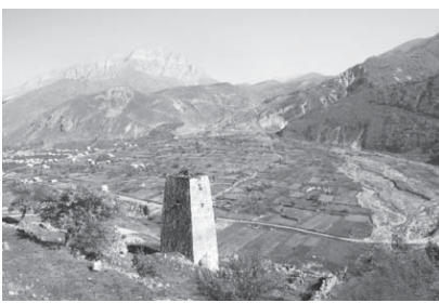
Общий вид села Верхняя Балкария.

Окрестности Верхней Балкарии – это практически музей под открытым небом. Старинные башни белеют на склонах горы, где сохранились развалины домов, в которых люди жили до страшного дня – 8 марта 1944 года – сталинской депортации. Мемориал Сауту, сооруженный по инициативе и на средства потомков следопытцев, изредка посещающих туристов, напоминает о том трагическом периоде. Вернувшись, люди стали селиться на пологих участках у стремительного Черка. Свои сельские жители считают местом благодатным. Идут бы ни жили люди, везде и дождливо, здесь светит солнце. Наверное, поэтому