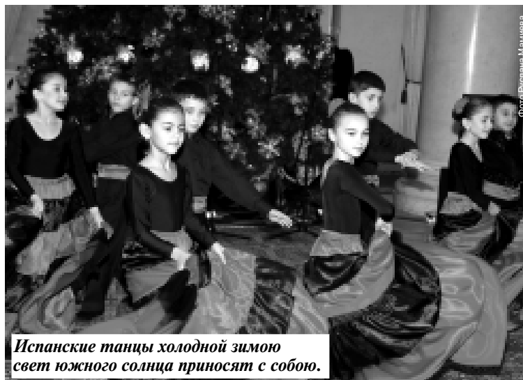
Испанские танцы холодной зимой свет южного солнца приносят с собою.

Ответы на сканворд, опубликованный 25 декабря