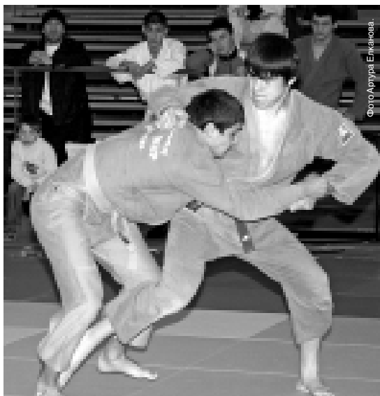
Материалы рубрики подготовил спортивный обозреватель Альберт ДЫШЕКОВ.

Парад открытия соревнований запланирован на 17 часов вечера. Отчеты об этих турнирах читайте в ближайшем номере «КБП».