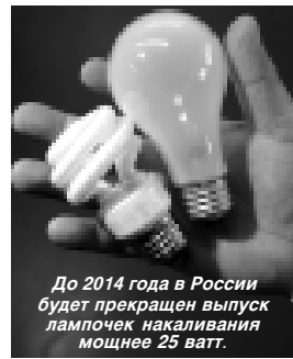
До 2014 года в России будет прекращен выпуск лампочек накаливания мощностью 25 ватт.

Напомним, что с 2013 года в России рекомендуется также прекратить производство и продажу ламп накаливания мощностью 75 ватт и более, а с 2014 года — мощностью 25 ватт. Одновременно Правительству необходимо будет принять правила утилизации использованных энергосберегающих ламп.