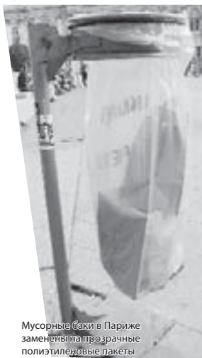
Мусорные баки в Париже заменены на прозрачные полиэтиленовые пакеты

Покупаем воду: надо же! Во Франции вода стоит дороже вина: полтора литра купили по полтора евро, тогда как бутылка вина стоит всего один евро. С чем это связано? Может,