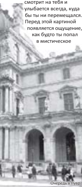
Очередь в Лувр

Как не увидеть Собор Парижской Богоматери, как в нем не