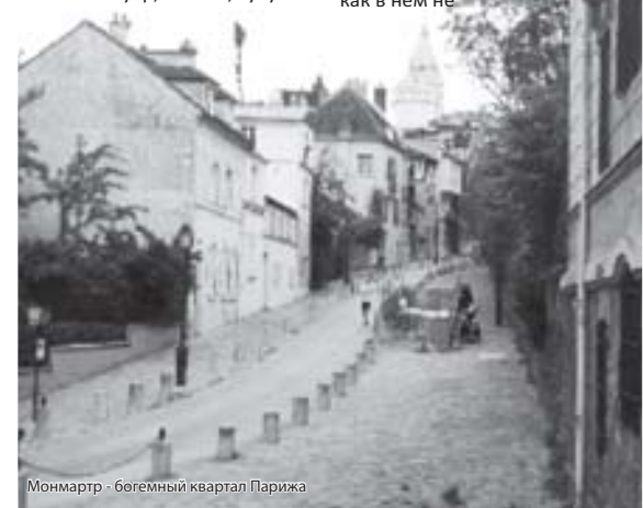
Монмартр - богемный квартал Парижа

Лично для меня самым ярким из трех счастливых дней в Париже был день посещения знаменитого Монматра (Гора мучеников). Здесь был убит святой Дионисий, проповедовавший христианство, и здесь построена знаменитая церковь – базилика Сакре-Кер. Сейчас жизнь на Монматре дорогая, но в конце XIX века это был дешевый район. И здесь в знаменитом теперь ветхом бараке снимали комнаты художники и поэты. В комнате помещалась одна кровать и был один гвоздь, чтобы повесить верхнюю одежду. Кран был в коридоре – один на всех. Ренуар, Ван Гог, Тулуз-