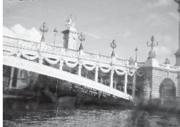
Мост над Сеной

Чтобы почувствовать город, недостаточно бродить по нему часами пешком, надо посмотреть и с воды. Путешествие на кораблике по Сене усилило ощущение величия Парижа. Конечно, самые большие