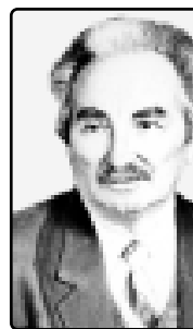
Шыгуагъэуахьын, и гур ныхъытхэм шыгъуагъэуахьын...