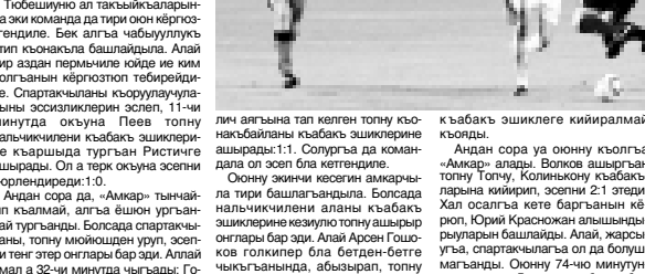
РОССИЙНИ ФУТБОЛДОН ЧЕМПИОНАТЫНЫ 29-ЧУ ТУРДУН СОРА ТАБЛИЦАСЫ