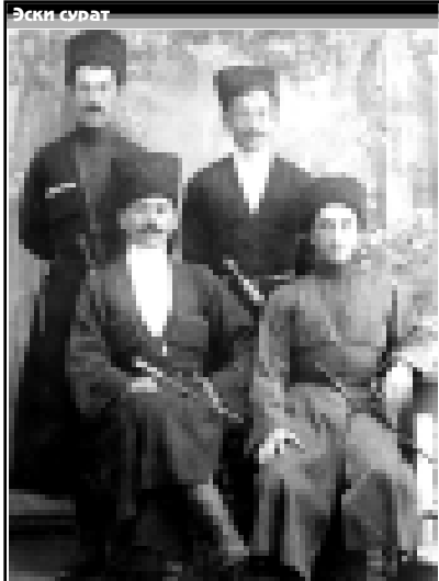
Отпурганнада сол жаңындан биринчи Чегемден тау бий Малкыруканы Далашды. Къалгъанлары атары тохтадырмалыгандыла. Ким биледи, ЛЕЙЛУН улу М.