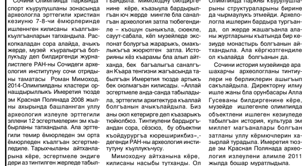
Олимпигида паркны кыруушуларыны структураларыны бирине да чырмаууга этмедиле. Археология ишлени бардыра турганды, ол жерде жашагыла аны журтларыны кытында бир кезиуде монастыр болганыны айтхандыла. Ала көрөгөтгөндиле ол кыалады болганды да.