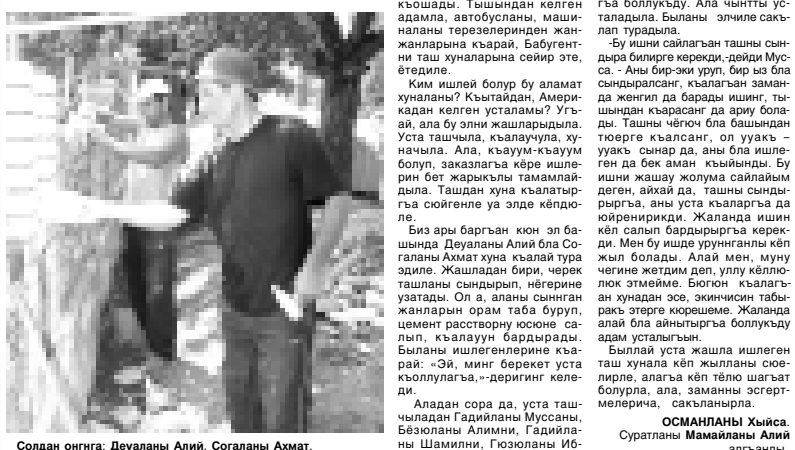
Таш бля тышпанага койле. Оу орамга, элге да айтбалык кыошды. Тышпандан келген адамла, автобусларны, машиналары терезелеринде жанжаларына кырай, Бабугенни таш хуналарына сейри эте, өтөдиле.

Ахыры. Аллы 1-чи бетдеи. Кыра, кызыл, сары ташыдан кыланган хунала да бир-биринден артык кыламдыла. Ала да бет байтамалдыла. Бюксонда ташы бир бирлеринде жеткен жерлерине парастор ызлары кыра болу бля болпаса. Алай хуналары Бабугенни Чирик келге, агачы заводка барганды ормаларында көрөгө болуктуу. Иш бля республиканы көп элдеринде болурга тошеди. Юй, журт, хуна ишпелде ташы хайырланганяны көрөкө да турабыз. Алай Бабугенни бир жерде да болмаз. Узун ормаларында таш бля тышпанага хуна кыламдыла. Дагыда быланы бир энчиликтери барды. Хар адам хунасын башха тюрлөрөк ишлетеди. Бир жерде эки бирчаны көрмөзө. Бир-бирле уа юйлерини орамга айланган кыбыргаларын да таш бля тышпанага койле.