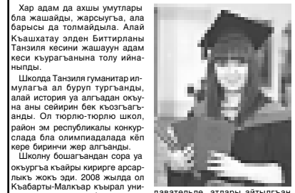
Давательле, атлары айтылган профессорула эм академикле окуу башланган биринчи конледен окууна бля шырылуу, уллу талпынуу бошайп тышыруу эспейдиле.