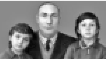
Сурат 1956 жылда алынганды.

Орусбий улу 1920 жылда Кырачайны бек эртеги элперинден биринде - Кьарт Журта тууганды. Элбрусун ары жагында, улуу Кыбан сууну бойунда. Тау этектеринде өскөн нарат, назы терекени аруу хауларыны кол, тазга гараладан ич өсгөндү. Элде жети классы таугаскандан сора Мекканы-Шахарындого Карачаевск педучилищеге киреди.