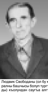
Людвик Свободаны (ол бу кыралы башчы болуп турганды) кьолундан сауга алганды.

Допински эл аруу орамларындын аруу Битирланы Назирин агын жибуртөди. Аны аскере Терк эл мюлк техникуму экинчи курсуну студенти болганында чакырылды. 1941 жылда апрель айда аскер куулугуна бардырыгуба деп жыйырмажыллык жашу Украинаны Злочев шахарына атланады. Аны 15-чи танк корпусу эни 544-чо связь ротасына жибериле.