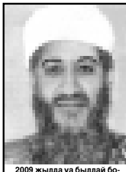
2009 жылда уа былай болурга боллукь эди...