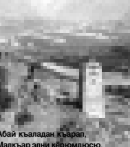
Абай къаладан къарар, Малкъар элини кёрюмдосу.