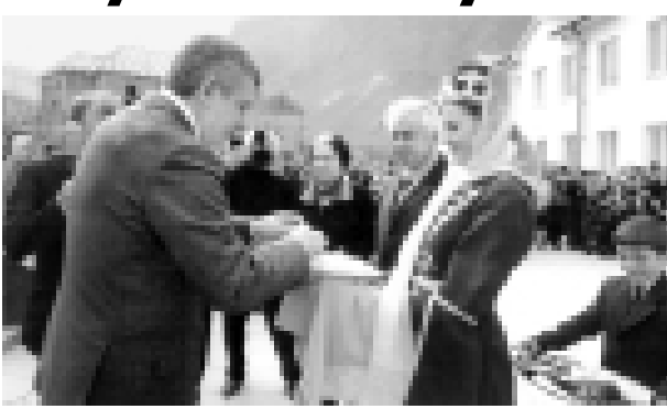
Отъары Малкъарны 2-чи номери орта школуну аялында.

Айтхылык алим Л. Гумилёв жазганына кёре, малкъарыла 6-чы ёмюрге дери да халк болуп, Шимал Кавказда жашагандыла. Аны Малкъар тарына хар ташы, тауу, сууу, кёпюрю, оюлгъан хуналары, кеп торлю таурула шагъатдыла. Ала, элибиниз озган заманы, къадарын кёз албызгъа келтир, аны жашуу жолуну тилосиз шакъаттарна, кеп торлю затланы эсимбеге саладыла.