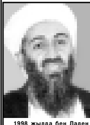
1998 жылда бен Ладен былай эди...