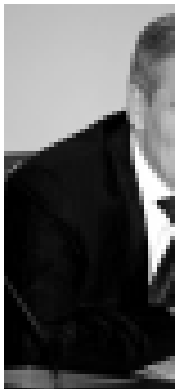
За прошедшие пять лет Арсен Каноков показал себя эффективным управленцем.