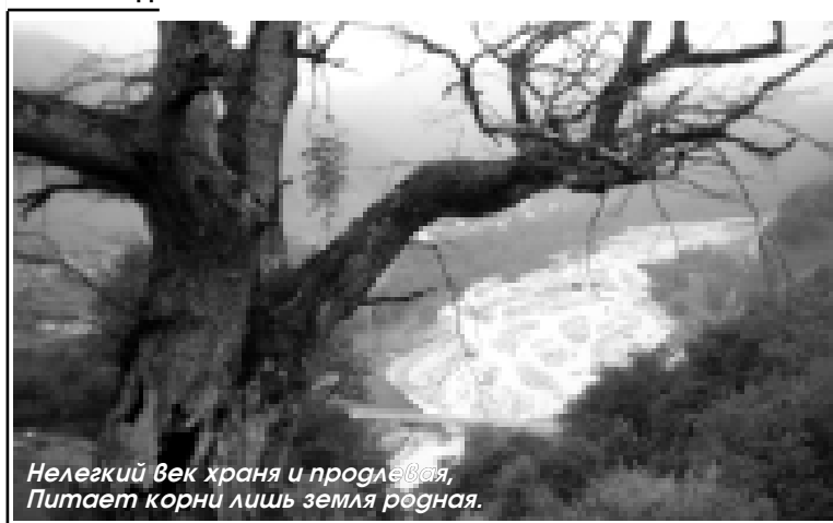
Нелегкий век храня и пролекая, Питают корни лишь земля родная.