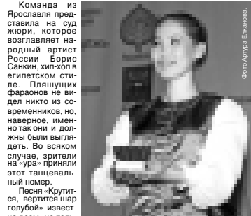
Танцуют конкурсанты из Самарской области.

леньких жизней в эти фестивальные дни полно на всех концертных площадках столицы республики. Музыкальный театр принимает гостей фестиваля, соревнующихся в танцевальном направлении.