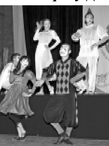
г. Сургут. Композиция «История одной души».

Фестиваль «Российская студенческая весна-2010» в самом разгаре. Команды из разных уголков России выступают на пяти площадках городского Нальчика. В Кабардинском драматическом театре имени А. Шаншугуева с раннего утра идут репетиции – до выступления остается всего два часа.