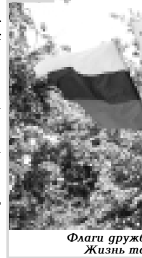
Флаги дружды, зелень мая — Жизнь такая молодая!