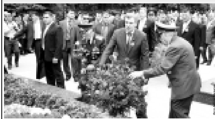
Арсен Каноков на первом разе участвует в зарубежных визитах высших руководителей страны.

Утром в день 65-летия Великой Победы возле мемориала «Вечный огонь славы» в городском парке столицы республики состоялось красочное мероприятие, в котором участвовали ветераны Великой Отечественной войны, руководство республики и администрации городского округа Нальчик.