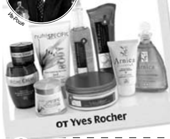
от Yves Rocher