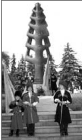
кавказской войны и фразой « Мы скорбим » на нескольких языках.

А 21 мая задолго до обозначенного времени торжественного митинга у «Древа жизни» стали собираться школьники, студенты, известные культурные и общественно-политические деятели, представители национально-культурных центров и общественных республики, ожидавшие завершения шествия молодых людей в национальной одежде с флагами по центральной улице Нальчика. Перед началом траурной церемонии всем присутствующим раздали символические ленточки зеленого цвета с датами