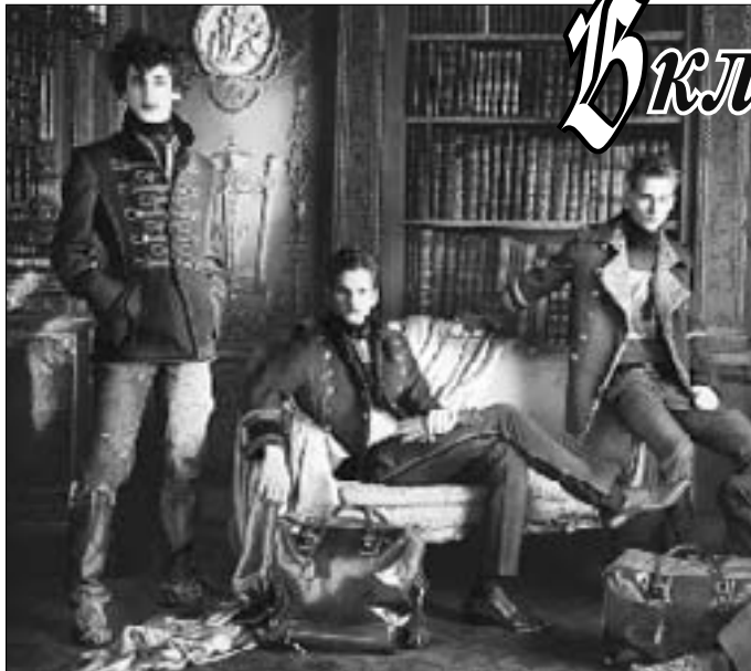
Милитари - стиль, который никогда не исчезнет