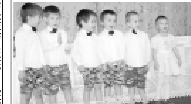
Арада турган сабиле жырлайды.