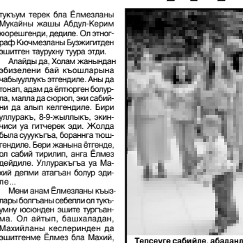
Тепсеуге сабиле, абаданла да баргъандла.