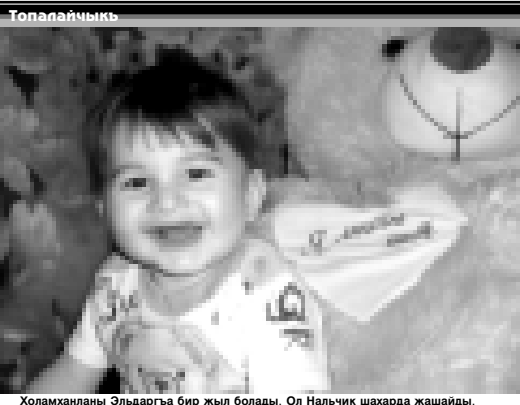
Холмахананы Эльдарга бир жыл болады. Ол Нальчик шахарда жашайды.