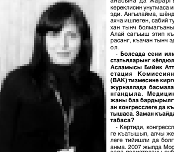
анасына да жарарга кереклин юнтумаса иги эди. Аныламы, шёбдо ахча ишлеген, сабий тутхан тынч болганды. Сагайлап, качкын тын эди ол. - Болсада сени илму статьяларын кёпюлдө. Асталысы Биик Атте-стафия Кюмюрёвны (БАК) тэмизине кирген журналда басмалангандыла. Медицина жаны бля бардырлыгач конгресслеге да къайтышма. Заман къайдан табаса? - Кертиди, конгресслеге къатышп, алчы жерлеге тийишли да болганыма. 2007 жылда Москвада Бюк педиагрияны ринчи конгрессинде ишми бек икте санам, «Берин-Хими» фармацевт компания саурга берген эди. «Саулуук эми билем беруу ХИ» выморардеген конференцияда республикада жички жери келтиргени. Заманы юсюнден айтханда уа, адам ишин сюереге келгенде, Кюмюрёвны илму статьяны къыйын атам бля бирге жазганам. Аны сабели суруган къыйын тюрюп эди. Анд сора СИТМ-ны чекде болумданы клиникасында диссертацияны материалла жазгын кезиудеме да юйренгенди. Илму консультантлы медицина илмуланы докторлары Михаил Юженко бля Игорь Боев да манга ичи болушарды. - Мындан ары уа къалай умтуларын бардыла? - Бир кесек солуп, болныча да, университетте да ишми кыайтыркъыма. Кесими билдимми, студентлеге берирге, арууган сабийликлеге болушуга болумула. Он борчуму къолюдан келгенине тамамларкъыма. Ушакны МОКЪАЛЫНЫ Зуура бардырланды. Сураты ХОЛАПАТЫ Марзип алганды.