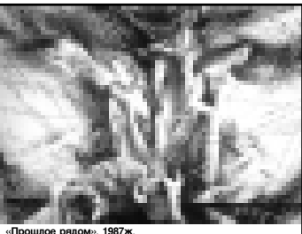
«Прошлое рядом», 1987ж.