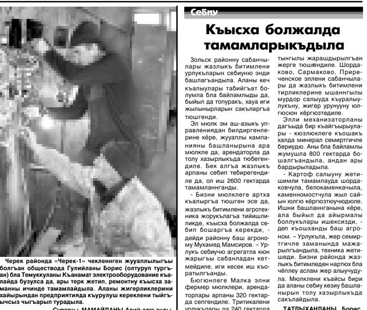
Суратыны МАМАЙЛАНЫ Алий алганды.