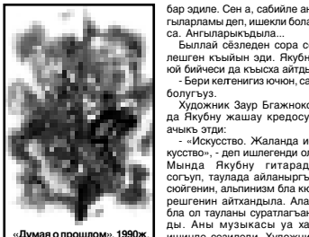
«Думая о прошлом», 1990ж.