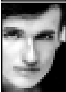
24 по горизонтали