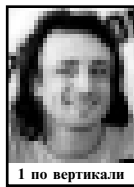
1 по вертикали

1. Отколовшийся от ледника дрейфующий ледяной массив с глубоко погруженной подводной частью. 3. Немецкий автоматический 8-зарядный пистолет. 5. Фото. 7. Бургундский монах, теолог, один из крупнейших философов Средневековья. 8. Фото. 11. Фото. 13. Геометрическая фигура. 14. Вид изобразительного искусства, включающий рисунок и печатные художественные изображения. 16. Фото. 17. Карликовое государство в Центральной Европе между Австрией и Швейцарией. 18. Идеология, направленная на возрождение еврейского самосознания через поощрение иммиграции евреев в Палестину. 20. Принцип, предназначенный для перевозки тяжелых неделимых грузов. 22. Фото. 24. Фото. 25. Различные виды объединения граждан для общей хозяйственной деятельности. 26. Преподобный Крестовоздвиженский монастырь. 27. В греческой мифологии бог – олицетворение смерти, брат-близнец бога сна Гипноса. 28. Фото.