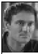
22 по горизонтали