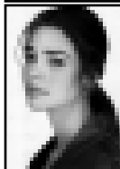
21 по вертикали