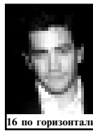
16 по горизонтали