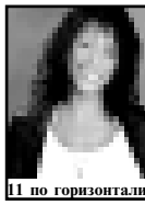
11 по горизонтали