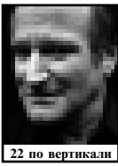
22 по вертикали