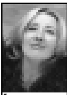
5 по горизонтали