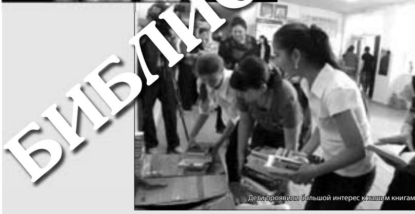
Дети проявили большой интерес к новым книгам

у каждого человека есть свой опыт жизни в мире книг, и он относится к графе «личное».