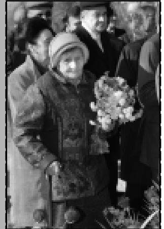
В минувшую среду Кабардино-Балкария, как и другие регионы России, отметила 90-летие ВЛКСМ

«Меня мое сердце в тревожную даль зовет»