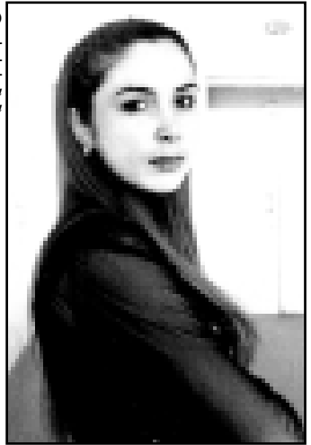
Си итIлгьэ сIэтрэ сьыныпIуэм, ЗыхуэмьшIуэу си псэр магъ.

Дэнэ лъонькыуэкIэ сымьыплэм Уи телъхэр сIошIэ сыт шыгъуи сылагуэ.