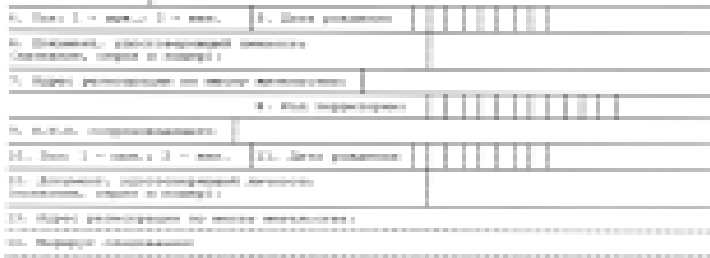
Министр здравоохранения КБР