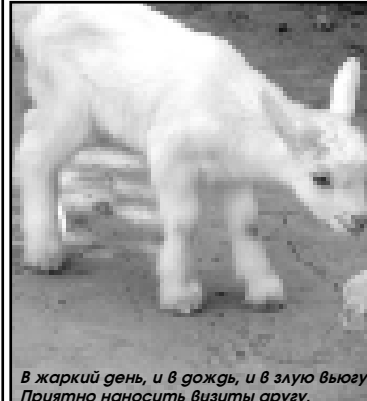
В жаркий день, и в дождь, и в злоую вьюгу Приятно наносить визиты друг.

Главный редактор Сусанна МЕЗОВА Редакционная коллегия Ф. Бозиева (зам. гл. редактора), Н. Конярева (зам. гл. редактора), Л. Умарова (отв. секретаря), А. Булатов, С. Шаммакина, З. Мальбахова.