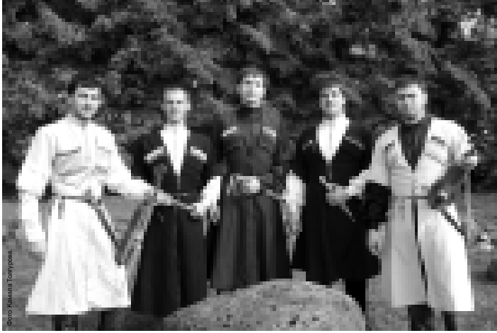
Фотомонтаж по фотографии

В Астрахани проходил Международный этнографический фестиваль «Конкурс «Голоса золотой степи»...»