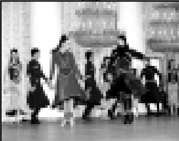
Захватывающий кавказский танец – это удачное сочетание национальной пляски и классического балета.