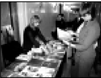
Экспозиция КБР: от книг первых просветителей до роскошных презентационных альбомов. Они вызвали неподдельный интерес как издательских кругов столицы, так и простых посетителей.