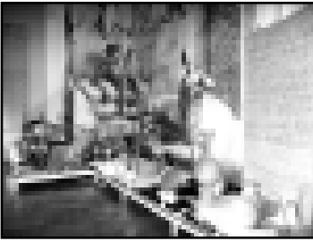
В Музее Востока хранят и уникальные произведения древних мастеров, и знания о старинных обычаях и традициях наших народов.