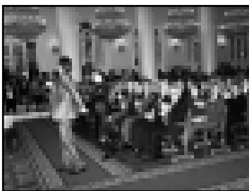
Танцевали не только на сцене, но и в зале.