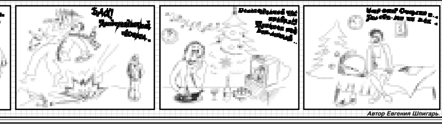
Автор Евгения Шлигарь.