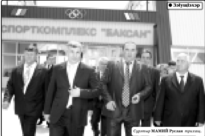
Суртыр МАМИЙ Руслан трихаш.