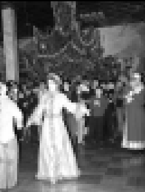
дети, но и взрослые - республиканские артисты. За символическую плату корпоративные утренки в вечернее время устроили для своих сотрудников один из банков...

Республиканский Дворец творчества детей и молодежи провел с 25 по 30 декабря традиционные новогодние праздники. Елочку до потолка подарили сами. Подготовили программы для младшего, среднего и старшего школьных возрастов.