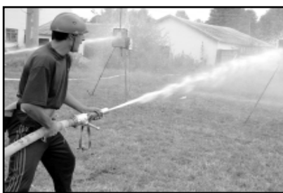
Стрельба по воображаемому очагу огня требует меткости.