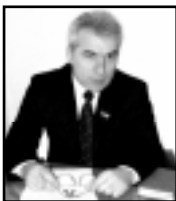
Министр образования и науки КБР

Проблемы образования, национальной культуры, национальной культуры неразрывно связаны друг с другом. Много говорится о том, что об-