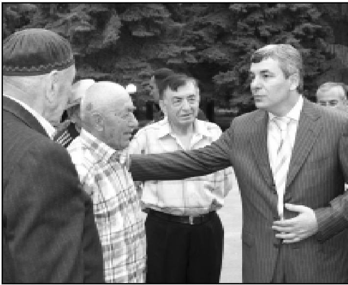
К советам старших стоит прислушаться.