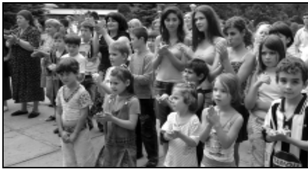
Подделиться и подружиться.