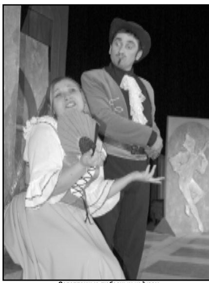
Ослепленные любовным недугом.