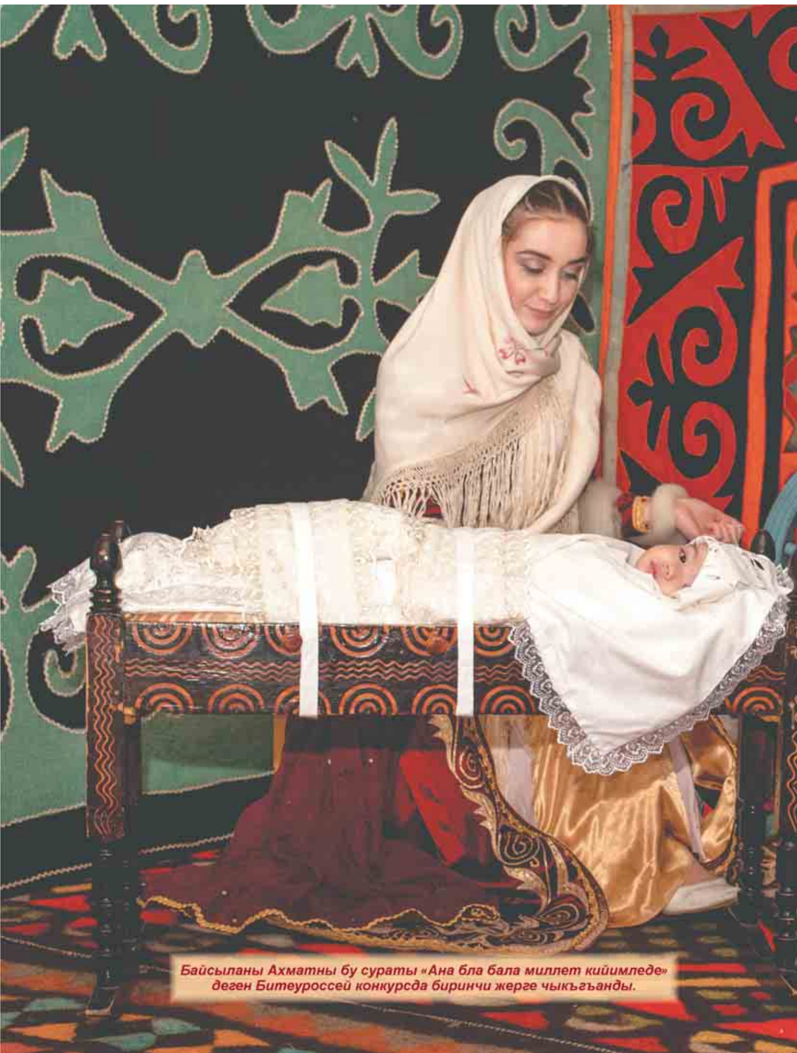
Байсыланы Ахматны бу сураты «Ана бла бала миллет кийимледе» деген Битеуроссей конкурсда биринчи жерге чыкъгъанды.