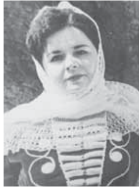
«Кёк ала», «Соймеклик», «Жюрюгюз, аланла, бирге жырлайыкь», д.а.к.