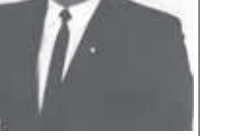
Атасы Хусей бла амань Ханниба.

Биз халкъыбыз къарангыркъыда жашагъанды дегерэ кийим толюбюз. Ол алай болмаганын быллай затла окуна тамам кёргозтуну турадыла. Миллет тауу жердеде жашуу эте келе эсе да, хар нени да билгенди адамлардыбыз. Быллай, эртеден къалгъан затлары керегез да, кеслери заманда эс буртманынгъа, къартларыбызда кепно сора билмеменинге, уллу кёпчюнонлюкне жарысыла. Аны бла бирге уа, жуушкъ адамларныгъа эсимлик, сейир да айтпалкъыды. Жаралы телефонла алагъа аслам затха чырмау болганылары жарысыла. Окутууда бизге къыйын болгъан а дерликени терк-терк портерлирини тургъанларды. Авторларыны да бир кийик болмаганылары. Энди бизге затла конструктор бла саулай да къыралны мектептерине