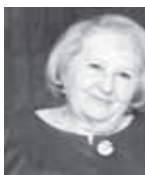
УЯНАЛАНЫ Ира, юй бийче.

- Биз Нальчикни Горной тийресинде жашайбыз. Алайгыа юй ишлеп кергенибизде, тегерекни агыч басып эди, журтла да бек аз эдиле. Алай, аз-аздан ол тийреде кеп кыатлы юйле ишлене, терекле уа кырыла башлайдыла. Мен а баш ием бла бирге бахчабызны тегерегине алма бла кертме, эрик бла балли терекле салганыбыз. Ала ёсоп,