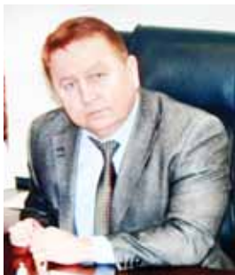
генерал-майор (контр-адмирал) чыннга тенгди.

Жерлешибиз бусагьатда Псков областьда суд департаментни башчысы, юстицияны 3-чю класслы кырал советниги, ол а