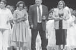
ДАЛАТЛАНЫ Марзият хазыраганды.

Анда билгенбизча, ол Кэабарты-Малкыр кырал университетинде да айырмалы бошак чыкканды. Ординатурасы Москвада бу клиникада ётерге барганында уа, анга алгы ите кесек тинтиулден, сынауладан ётерге тошгонди. Ординатураны заманы бошалганды уа, артка керге унамай кыуалгандыла. Билимди, ишин сойюн, ага битеу жорги бла берилген адамла кыяда да бек керекдиле. Бу клиникада уа бютонда».