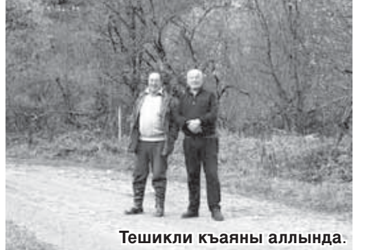
Тешикли къаяны аллында.