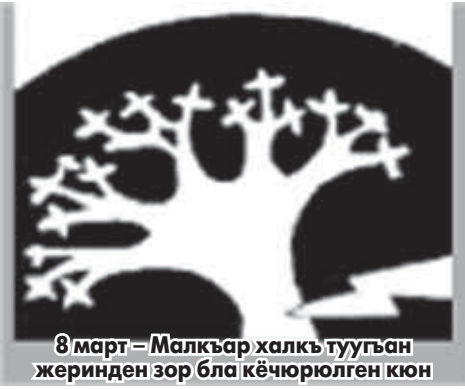
8 март – Малкър халкъ тууган жеринден зор бла кечюрюлген кюн

Малкърны байлыгы ёмюрледен бери да адамлары, ариу табийгаты, битими болганды. Уллу журтну ичинде кеп гитче элле, битеу тау элледеча, тукъум чеклеге юлешингендиле. Заман узакъгъа кетген эсе да, бюгюн да ол орамчыкъланы, анда жашагъан тукъумланы биледиле. Кимни къайдан чыкъгъаны, жамауатны ичинде не иш тындыргъанын таматала бюгюн да айтырыкъдыла.