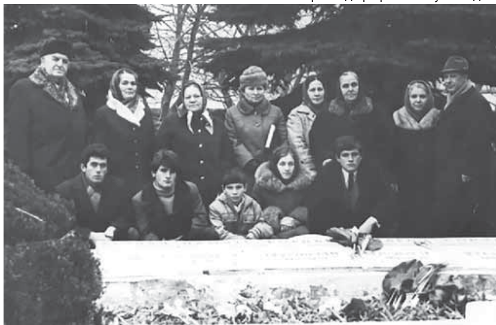
Ахлулары Ахматны обосыны къатында.

жанына бурлукъду деп, анга ийнангандыла, анга къуллукъ да этгендиле.